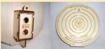
Fotograf N. Darman

LAKITES je aktivna večvalovna resonančna spodbuda celičnim oscilacijam po Lakhovskem. Z avtentičnim napajanjem na zunanjem obroču okrepi polje delovanja za večkratni faktor. Namenjen je za prostor doma in v službi za pritrditev na steno. V območju celotnega stanovanja oddaja zlati frekvenčni spekter vibracij, s katerim se lahko uglašijo vse celice in organi. Deluje trajno, občasno se zamenja baterija. Premer 20 cm, cena 220 €.