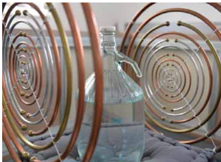
Z večvalovnim oscilatorjem obdelana voda je mehkejša in zelo pitna; pravo nasprotje od neobdelane vode iz pipe.

Večvalovni oscilator je bil sprejet v mnogih bolnišnicah v več državah kot preizkušena in uspešna terapija proti vsem boleznim, tudi najhujšim. Veliko zdravnikov tistega časa je evidentiralo na desetine in stotine ozdravitev pri svo-